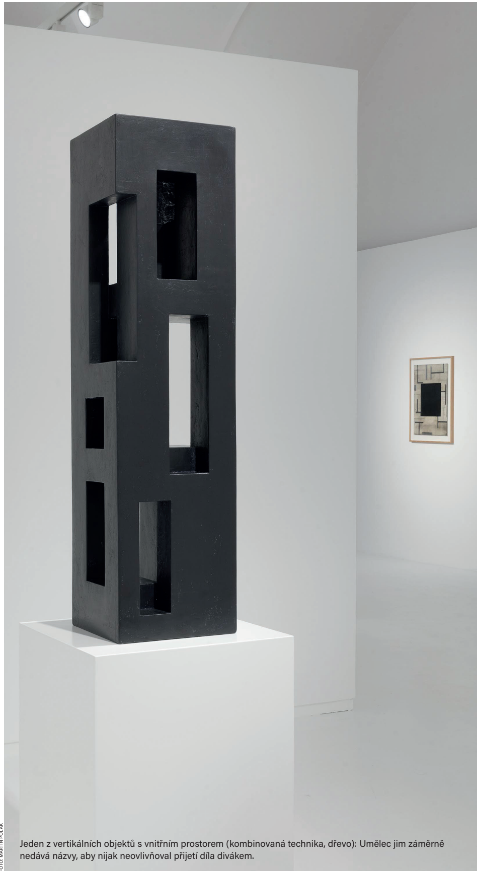
Jeden z vertikálních objektů s vnitřním prostorem (kombinovaná technika, dřevo): Umělec jim záměrně nedává názvy, aby nijak neovlivňoval přijetí díla divákem.