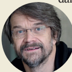
Dan Bárta, zpěvák