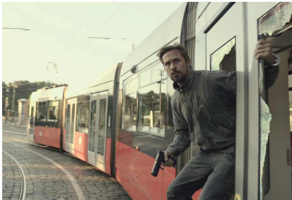
Ryan Gosling se v pražské tramvaji necítí bezpečně...

Zápletku filmu z produkce Netflixu je adaptací stejnojmenného románu Marka Greaneyho a nepůsobí nikterak novátorsky: CIA dá dohromady tajný program Sierra – jednotku složenou z kriminálních, kteří pak po světě řeší palčivé problémy. Ryan Gosling vystupuje pod přezdívkou Sierra Six a v úvodu během efektní silvestrovské přestřelky zlikviduje svého služebně staršího kolegu. Vzápětí spolu se svou kolegyní Dani (Ana de Armas) odhalí spiknutí jeho vlastních nadřízených. V tu chvíli se stává terčem nemilosrdného Lloyda Hansena (Chris Evans), jemuž se prozatím do spárů dostává Goslingův učitel (Billy Bob Thornton). Scénář si z románu bere to nejnepatřlivější a děj stáčí na akční horskou dráhu, jejíž klíčové situace se odehrávají v Praze anebo v přilehlých městech (Berlín, Vídeň), která stej-