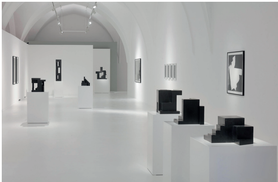
Pohled do instalace výstavy Michala Škody Stopy, kterou je až do 20. listopadu možné navštívit v Alšově jihočeské galerii na zámku Hluboká.

Zajímavé je, že stejně Škodovy objekty obtočí i v souvislosti s klasickými historickými interiéry, jaké jsou typické pro Trojský zámek v Praze, kde umělec právě vystavuje spolu se sochařem Čestmírem Suš-